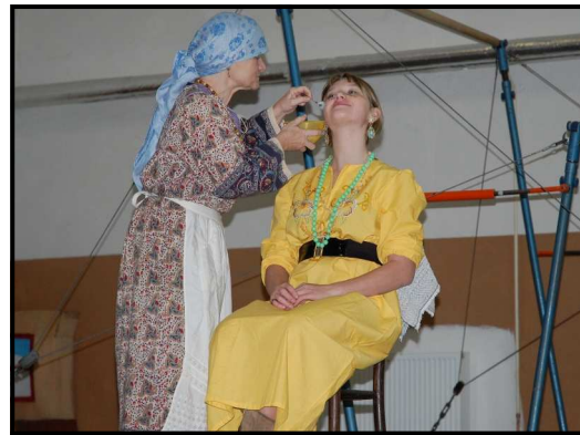
MRAZÍK. Komická hra z produkce Báry Kuchtové se v prosinci odehrála v místní sokolovně. V hlavní roli baby Jagy se předvedla i vynikající Mgr. Beránková.