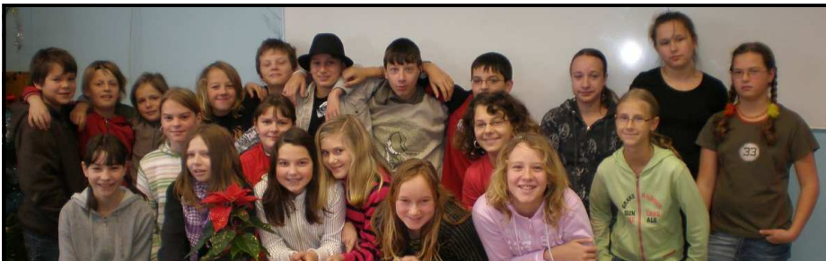
PRIMA 08/09. Každoroční, trochu opožděné představení nových studentů milevského gymnázia.