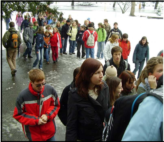
PŘEDVÁNOČNÍ POHODA. V pátek 12.12. (magických 12 dní před štědrým dnem) se v kulturním domě konal koncert Milevského dětského sboru. Jako jeho host dorazil sbor Úsměv z Borovan v Českých Budějovicích. Fotografie vlevo zachycuje příchod ke kulturnímu domu, fotografie vpravo vánoční koncert samotný.