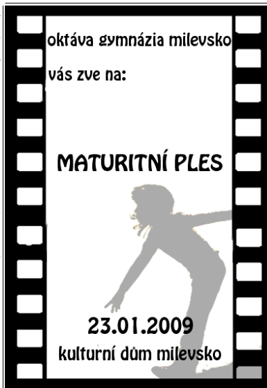
Neplacená inzerce, drink@gym.milevsko.cz