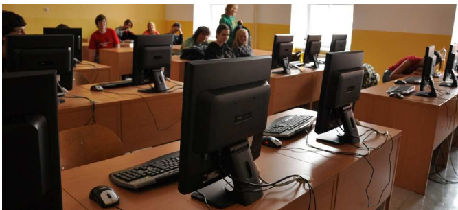
NOVÁ multimediální učebna v prvním patře.

A jak tedy v průzkumu české školy dopadly? V dnešní době je již internet téměř v každé domácnosti a stejně tak téměř v každé škole. Pouze 27 oslovených škol nemá internet. Hlavní typy připojení jsou vysokorychlostní ADSL a bezdrátové připojení. První zmiňovaná možnost si z koláče ukrojila 50% a Wi-Fi (bezdrátový přenos dat) 40%.