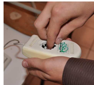
ZNIČENÁ MYŠ zůstala po vandalech, kteří vyndali kuličku, a tak se stala nepoužitelnou. drink/kk

počítač v chodbě u chlapčích záchodů v prvním patře. Volnost má ale svá úskalí. Kuličková myš, která byla u počítače s připojením, přišla o svou nejvýznamnější část: o kuličku.