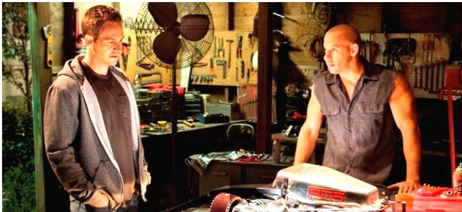
ZNOVU uvidíme staré známé tváře, třeba Vina Diesela. Novinky.cz

Příběh začíná zběsilou krádeží benzínu a divákům je