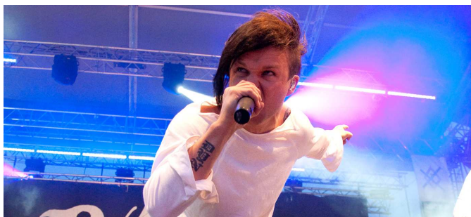
THE RASMUS. Tahák festivalu spolkl čtvrtinu celého rozpočtu.

v duchu očekávání headlinera celého festivalu, finské skupiny The Rasmus, pro niž bylo přešticé vystoupení jedinou zastávkou v ČR při turné k nové desce Black Roses. Jejich nejvěrnější fanoušci se zuby nehty drželi míst pod pódíem už od rána, takže zmokli při koncertu Totálního Nasazení, které na počasí nedbalo.