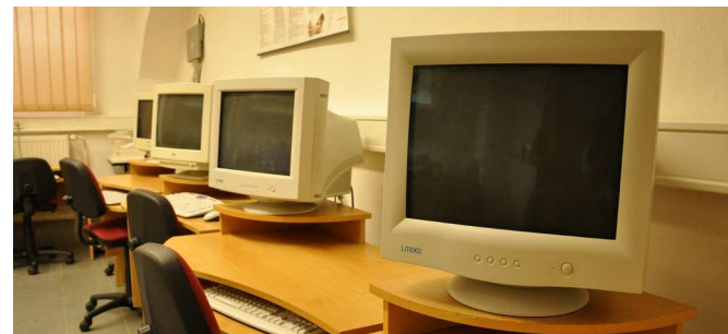
STARÁ učebna informatiky v přízemí.

O současnosti a plánech do budoucna se s námi podělil opět Jiří Školník: „Technická situace se zlepšila, nyní nám už jen zbývá osadit počítače na zbylá místa v nové učebně a ve staré je nutné postupně