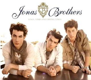
JONAS BROTHERS vydali druhé album s názvem Lines, Vines and Trying Times.