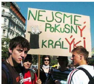
PROTESTŮ proti státním maturitám bylo hned několik. Teď se zdá, že měly význam.

A je to tu znovu. Poslanci ve středu 9. září odhlasovali odložení státních maturit o jeden rok. Problémem je prý velká nepřipravenost celého projektu, a to hlavně v jazycích a matematice.