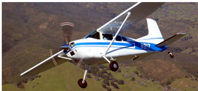
IF Cessna, lehký vrtulový letoun.

Zaspíval si i několik písniček a „pobavil“ pracovníky letové