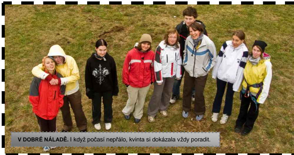
V DOBRÉ NÁLADĚ. I když počasí nepřálo, kvinta si dokázala vždy poradit.