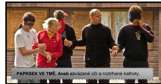
PAPREK VE TMĚ. Aneb zavázané oči a roztrhané kalhoty.

Kurz kvinty proběhl 15. až 17. září, kurz 1. A týden předem.