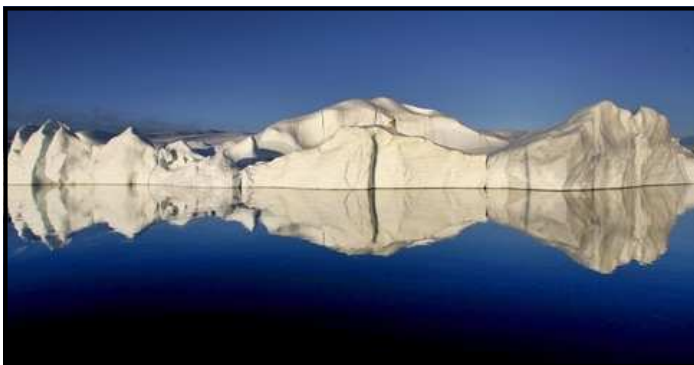
LEDOVCE TAJÍ. Kvůli odkryté mořské ploše uniká metan.

Podle vědců tání ledovců, které prý do roku 2030 úplně roztají, nejen zpřičinuje změnu rostoucí teploty celé planety, ale rovněž bylo nově zjištěno, že se pod mořskou hladinou skrývají tuny velmi nebezpečného metanu. „Vypadalo to, jako kdyby voda vařila,“ popsal objev badatelů významný němec-