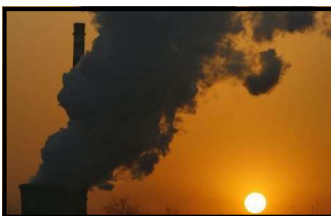
ZNEČIŠTĚNÝ VZDUCH. Ilust. foto

Svět/ Žebříček deseti „nej“ věcí, ze kterých Greenpeace rozhodně nemají radost.