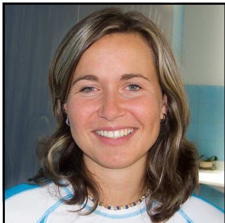
VŽDY S ÚSMĚVEM.