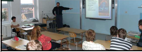
MĚSÍC PŘEDNÁŠEK. V listopadu na škole proběhly dvě přednášky. První patřila drogám (foto nahoře) a druhá využití zdrojů energie (foto dole).

Neplacená inzerce, drink@gym.milevsko.cz