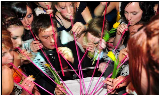
MATURITNÍ PLESY. Na přelomu letošního roku se třídy oktáva (vlevo) a 4.A (vpravo) v milevském Domě kultury pomyslně rozloučily se svou střední školou skrze své maturitní plesy.