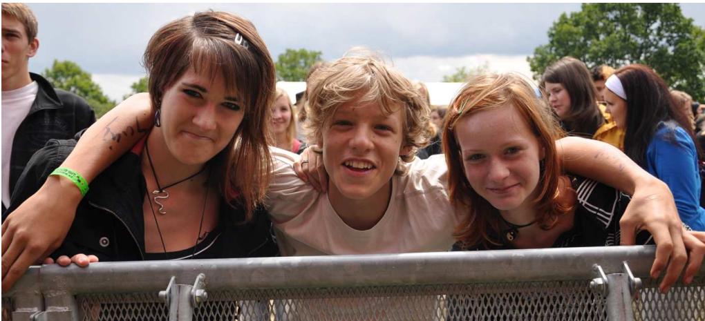
ČEKAJÍ NA KONCERT. Koho bylo na festivalu nejvíc? No přece těch Milevských!

Open Air Music Fest se opět předvedl a ukázal známé tváře