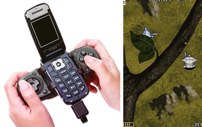
MOBILNÍ HRU už nejsou zdaleka takové, jaké bývaly kdysi. mobilmania.cz