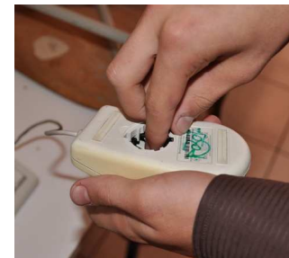
ZNIČENÁ MYŠ zůstala po vandalech, kteří vyndali kuličku, a tak se stala nepoužitelnou. drink/kk

Škola - Počínaje začátkem školního roku byl na milevském gymnáziu zaveden veřejný přístup na internet. Každý, kdo se chce podívat na web nebo si popovídat s přáteli, má možnost přístupu na