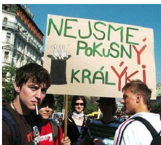
PROTESTŮ proti státním maturitám bylo hned několik. Teď se zdá, že měly význam. novinky.cz

A je to tu znovu. Poslanci ve středu 9. září odhlasovali odložení státních maturit o jeden rok. Problémem je prý velká nepřipravenost celého projektu, a to hlavně v jazycích a matematice.